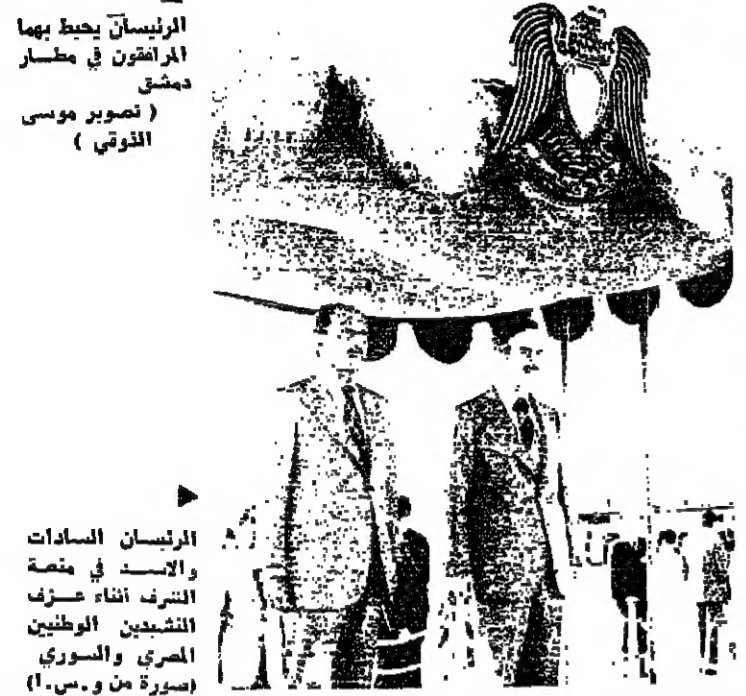
الرئيسان السادات والسادات في دمشق الشرفاء عذري المشيعين الوطنيين العمري والسوري